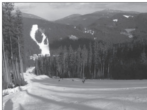
Fot. 1. Ośrodek narciarski Białá (Bílá) w Beskidzie Śląsko-Morawskim, zmodernizowany w latach 2008–2009, (fot. J. Havrlant, 2010)

Czeskie Beskidy dysponują wysokim potencjałem rozwoju ruchu turystycznego. Same jednak wartości przyrodnicze i kulturowo-historyczne nie są wystarczającymi czynnikami przyciągania turystów. Jak pokazały zaprezentowane opinie respondentów, region jest oceniany jako atrakcyjny i ma duże możliwości turystycznego rozwoju, pod warunkiem lepszego wyposażenia w urządzenia infrastrukturalne. Konieczność podjęcia nowych inwestycji wynika także z silnego powiązania funkcjonalnego z aglomeracją ostrawską, bowiem stanowi on dla jej mieszkańców tradycyjne zaplecze rekreacyjne. Dobre perspektywy jawią