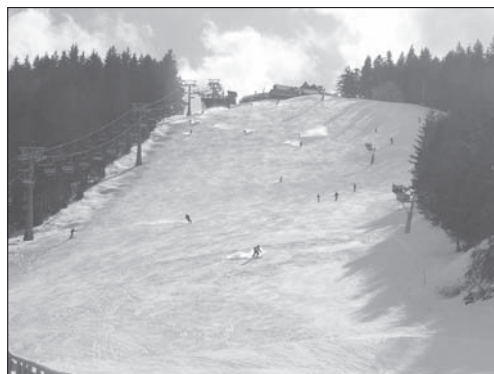
Fot. 2. Ośrodek narciarski „Ski Centrum Kohútka” na terenie Jaworników, zmodernizowany w 2010 r. (fot. J. Havrlant, 2010)

Photo 1. "Ski resort Bílá" in the Moravian-Silesian Beskids, modernised in 2008–2009, (by J. Havrlant, 2010)